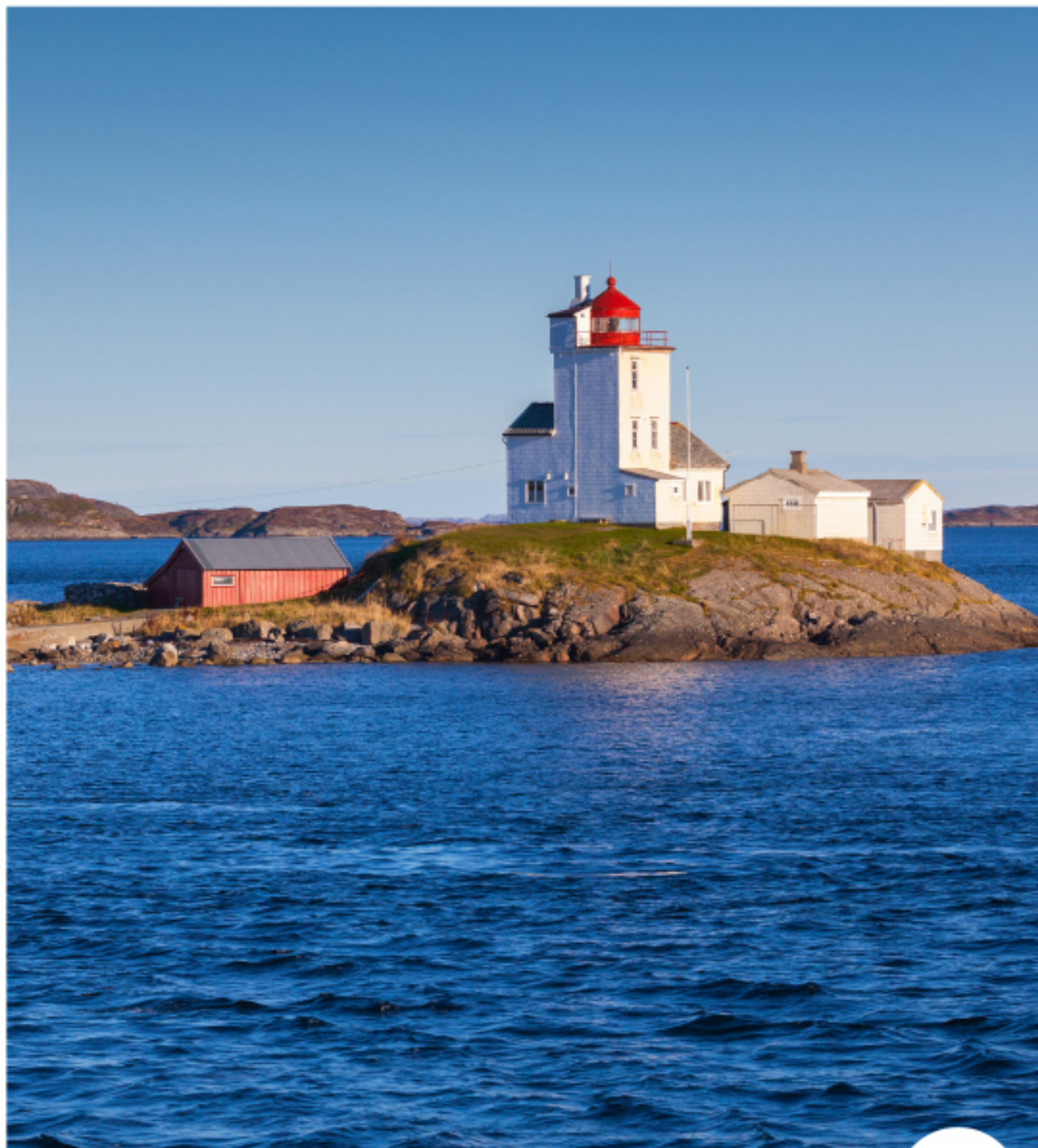
Tyrhaug fyr, Smøla