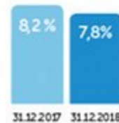
Utlånsvekst siste 12 mnd.